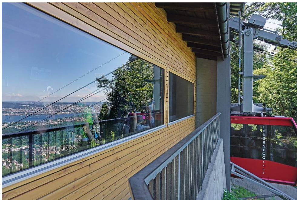
Die Felseneggbahn fährt in die Bergstation ein.

Die LAF wurde bei der Zufriedenheitsumfrage im September 2022 sehr gut bewertet.