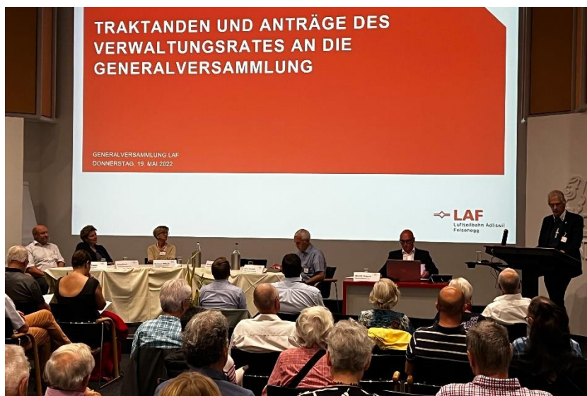
Die Generalversammlung der Luftseilbahn-Adliswil Felsenegg LAF AG fand am 19. Mai 2022 in Adliswil statt.