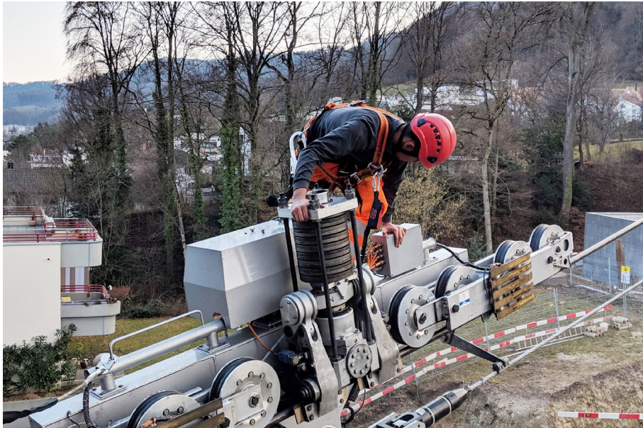
Ein Mitarbeiter der LAF prüft das Laufwerk.